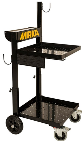
Trolley für Industriesauger