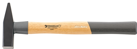
70110011 10961 500 G SCHLOSSERHAMMER Schlosserhammer 500 g L.320 mm