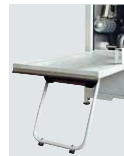
Cavalletto blocca porta Caballete de bloqueo puerta Door lock stand Türhalterung