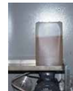
Ripiano interno detergente Estante interno detergente Internal detergent shelf Waschmitteltank Intern Regale