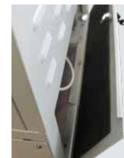
Kit insonorizzazione Kit antiruido Soundproof kit Schalldämmungssatz