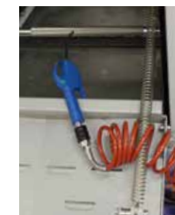
Kit soffiaggio esterno Kit de soplado externo External blowing kit Außen Blase kit