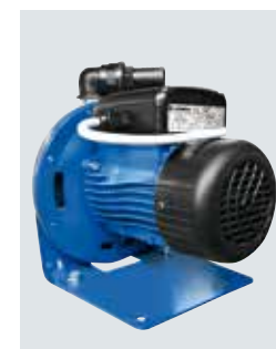
Pompa di rilancio Bomba de relance Booster pump Booster Pumpe