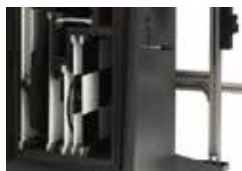
Bequem: Tafel für das zu kalibrierende Fahrzeug auswählen.