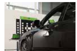
Unkompliziert: Kalibrierung von Frontkamera und Frontradar.