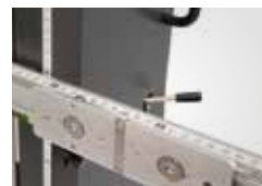
Leicht und sicher: Die Feinjustierung der Kalibriertafeln.