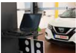
Einfach und schnell: Das Fahrzeug vor dem DAS 3000 platzieren.