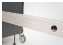
Präzise: Die richtige Positionierung und digitale Abstandsmessung.