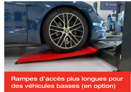
Rampes d'accès plus longues pour des véhicules basses (en option)