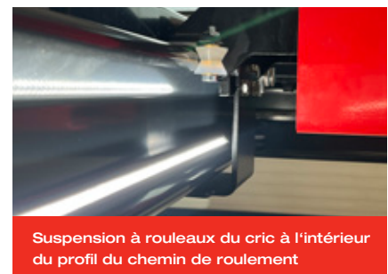
Suspension à rouleaux du cric à l'intérieur du profil du chemin de roulement