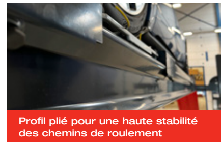
Profil plié pour une haute stabilité des chemins de roulement