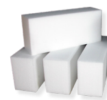
Tamponi in tecnopolimero 100 x 150 x 340 mm