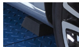
Tamponi a troco di piramide