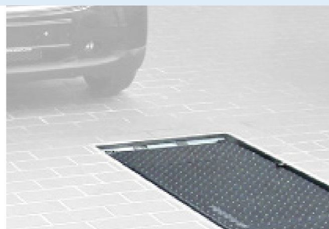
Versioni per installazioni a pavimento o ad incasso