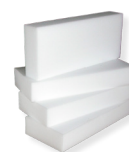
Tamponi in tecnopolimero 50 x 150 x 340 mm