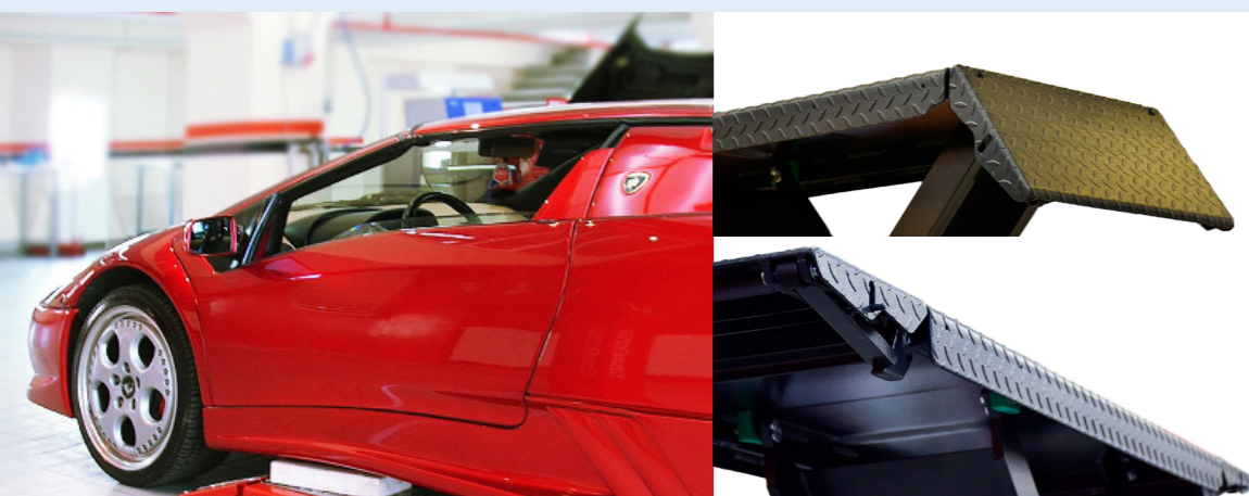
Pedane molto basse: perfetto per vetture sportive

JUMBO LIFT NT 3500, 4000: OFFRIAMO LA GIUSTA PORTATA PER OGNI AUTOFFICINA