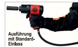
Ausführung mit Standard-Einlass