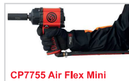
CP7755 Air Flex Mini

Diese arbeitserleichternde Innovation gewährleistet, dass sich der Schlauch immer in der idealen Position befindet und auch schwer erreichbare Stellen leicht zugänglich sind.