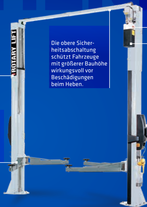
Abbildung zeigt SPO40E mit optionalem Zubehör.

Für ein Plus an Ergonomie und Wirtschaftlichkeit ist das 2. Bedienteil bei der SPO40 serienmäßig. Eine Bedieneinheit ist mit einem 220V Anschluss (mit 16 Ampere für elektrische Handwerkzeuge abgesichert) und das zweite mit einer Druckluftvorbereitung ausgestattet.