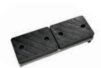
Abdrück-Distanzstück für kleine Räder