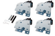
Adapter für Motorräder und Motorroller für TCE 4400-22 (4 St.)