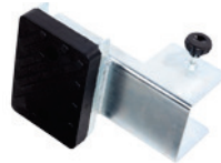
Abdrückadapter für Motorradreifen