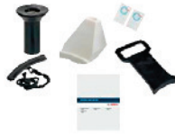
WDK-Kit für Run-Flat- und UHP-Reifen