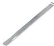
Montiereisen (WDK-Modell) TCE 4400/4400-22