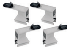
Adapter für Motorroller für TCE 4400 (4 St.)