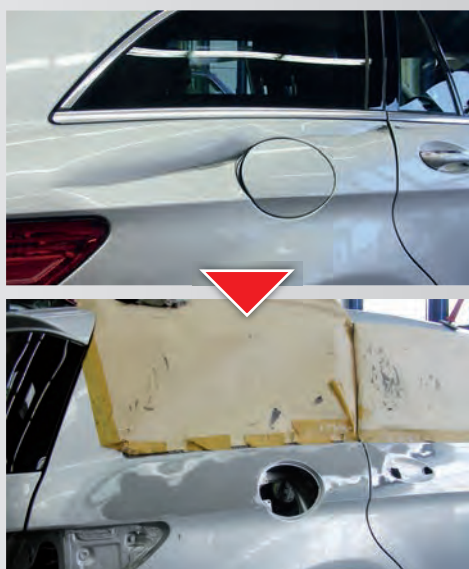
Produkttest im Allianz Zentrum für Technik