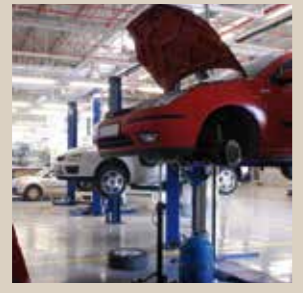
Auto - Moto