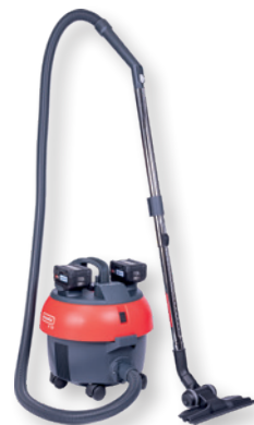
S10 Plus CAS