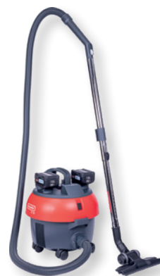
S10 Plus CAS