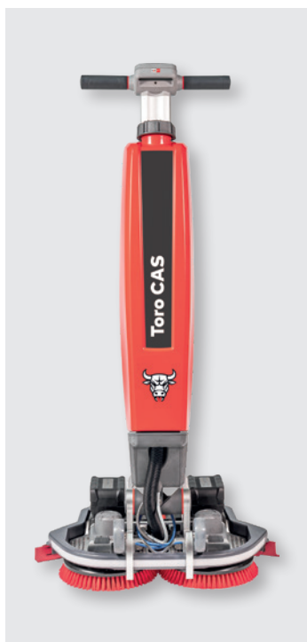
Cleanfix Toro CAS in posizione di lavoro