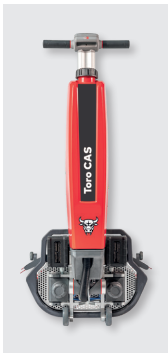
Cleanfix Toro CAS in posizione di trasporto