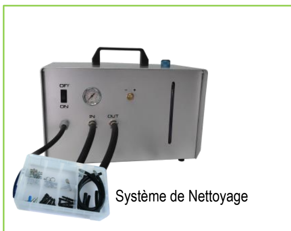
Système de Nettoyage