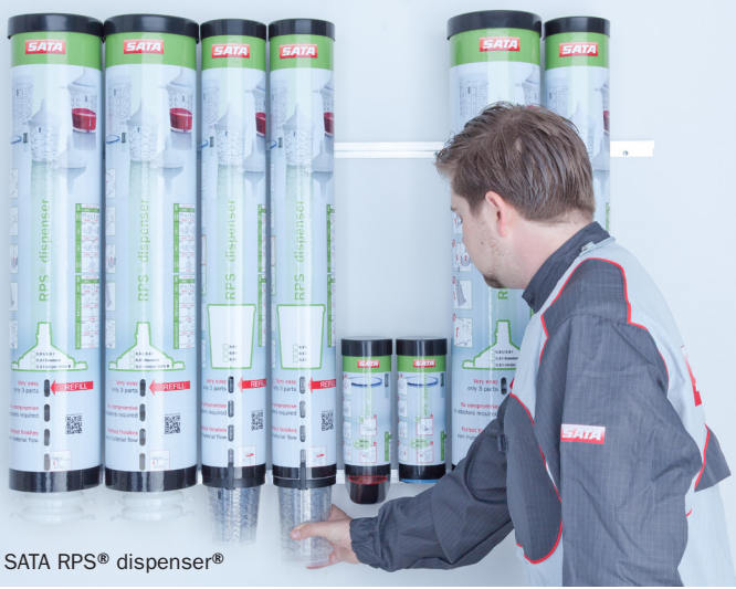
SATA RPS® dispenser®